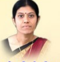
કુ. એન.વી. સોરઠીયા ઉચ્ચ.માધ્ય.શિક્ષક